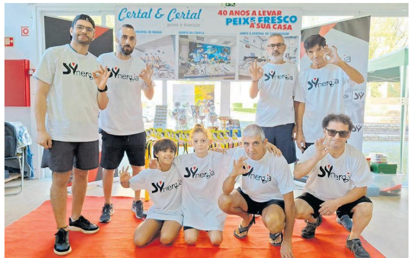
Equipa do Pelames FC é constituída por oito elementos - é uma conjugação de gerações, que começa nos oito e acaba nos 65 anos

“O clube aqui em Braga fez um trabalho extraordinário porque, não tendo sequer passado um ano desde a sua primeira participação, tem já aqui uma jornada. Nós sabemos que um dos passos mais difíceis é efectivamente organizar uma jornada. Houve uma preocupação de que esta fosse a primeira jornada para que a adesão fosse maior. Nós